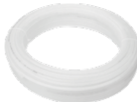
MANGUERA NYLON LECHOSA DSN