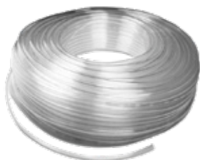
MANGUERA PU TRANSPARENTE DSN