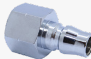
PITORRA HEMBRA PARA ACOPLE