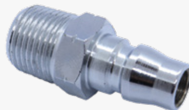
PITORRA MACHO PARA ACOPLE